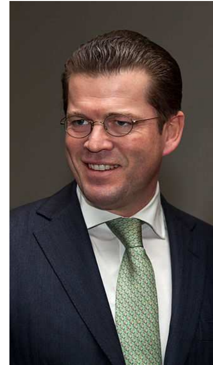
Abb. 1: Karl-Theodor zu Guttenberg (2011)